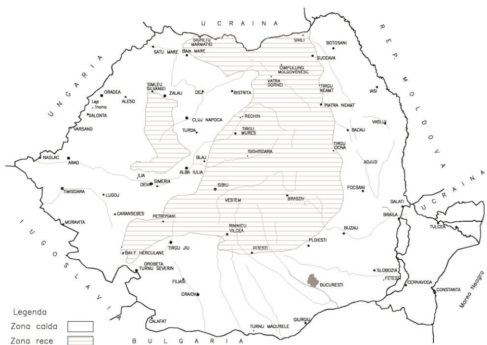
Fig. 9 – Zonare climatică